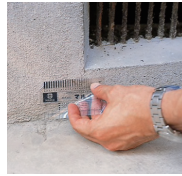
コンクリートのひび割れをチェック

外見では判断できない内部の状態を、経験豊富な耐震診断技術者が調査し、耐震度だけでなく耐久性の問題も明確にさせていただきます。